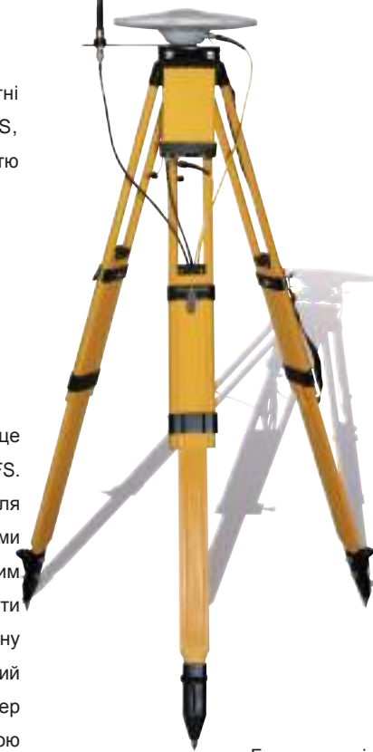
Базова станція RTK

Система керування AFS може бути підлаштована під потреби користувача, надаючи можливий рівень точності від 20 до 2 см. OmniSTAR XP/HP та G2 пропонують точність від 7 до 12 см, доступну в будь-якому куточку світу. Новий сигнал Center Point RTX віднині гарантує точність до 4 см безпосередньо з супутника. Базова станція RTK забезпечить Вам неймовірну повторювану точність у 2 см.